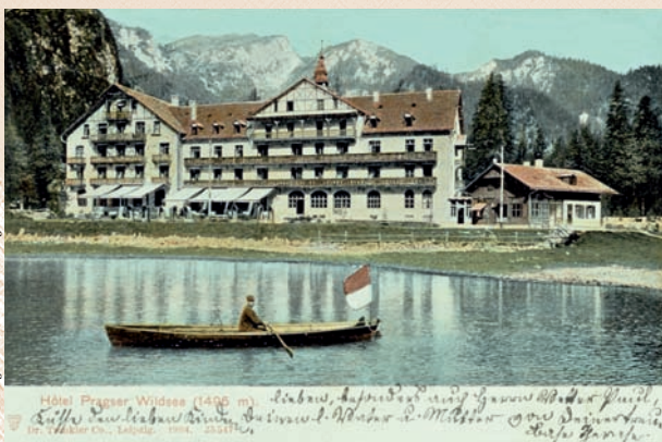
L'Hotel visto dal lago su un'antica cartolina postale.

di Villabassa, dirige un hotel alpino moderno, che si è assicurato il gradimento dei numerosi visitatori”.