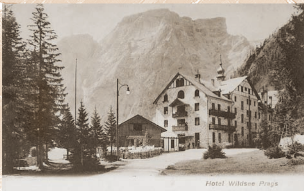
L'Hotel Lago di Braies dopo il suo primo ampliamento nel 1903.

della prestigiosa opera egli si assicurò la collaborazione del noto architetto viennese Otto Schmid. E Schmid poté a sua volta contare sulla consulenza di un meritevole noto pioniere del turismo il dott. Theodor Christomannos cui si deve la realizzazione della strada delle Dolomiti. Entrambi avevano fondato l'associazione dei Grand Hotel alpini, che si prefiggeva per l'appunto la